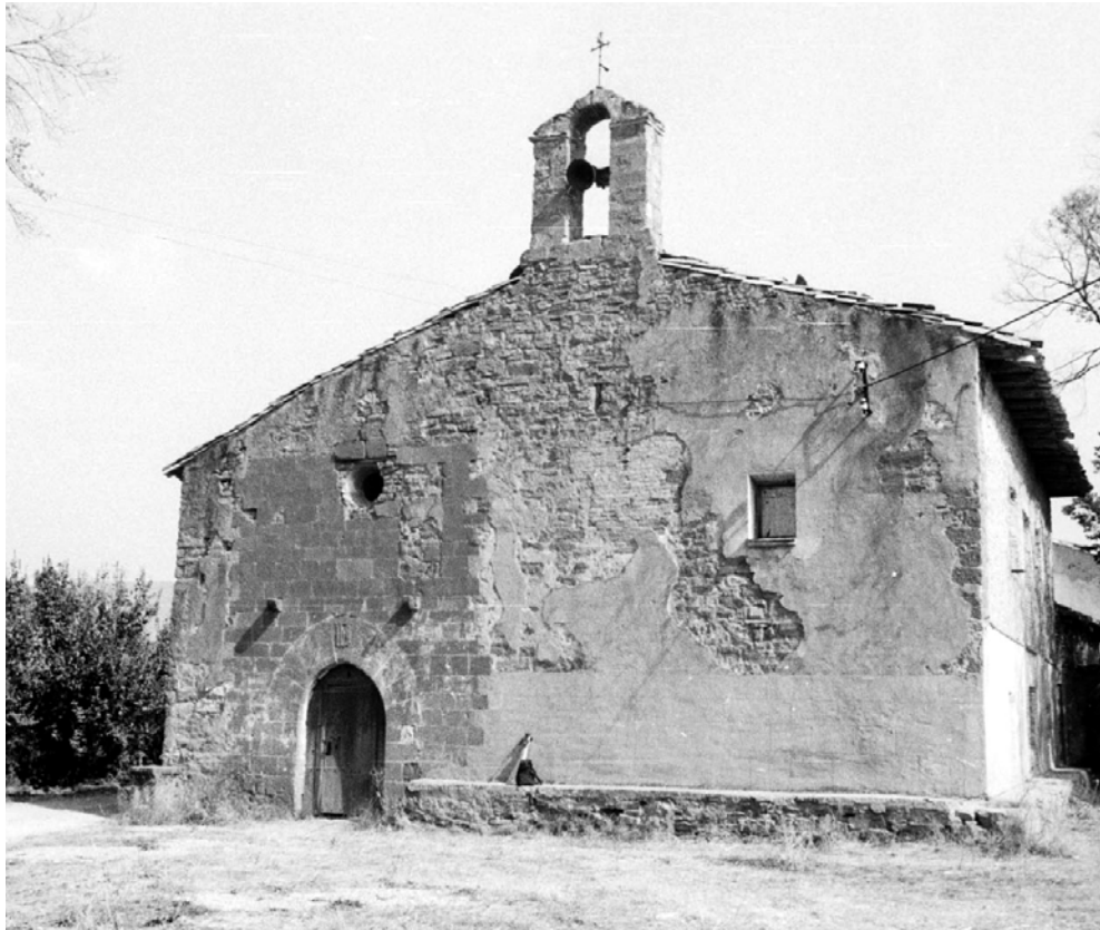
La Real Basílica de San Babil antes de su restauración.