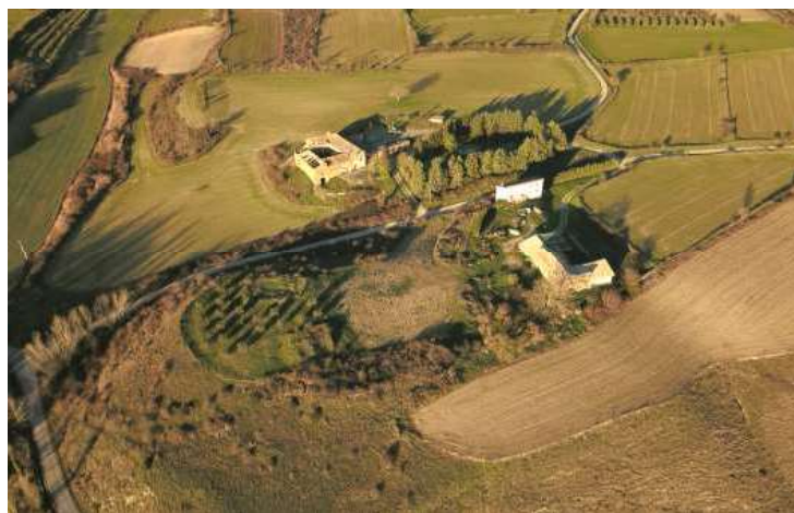
Vista aérea del cerro donde se asentaba La Real.

de La Real, por los que ante la queja del abad, Jaime II ordenó al citado merino que dejara que el abad percibiera los diezmos y otros derechos de la iglesia 14 . También el alcaide de Sangüesa con la creación de la nueva villa se vio privado de unos derechos que recaudaba sobre los lugares de Añués y de Lerda en cumplimiento de un acuerdo que poseía con el monasterio de Leyre, por lo que el rey de Aragón solicitó que el alcaide se arreglara con el abad de Leyre y dejara de vejar a los hombres de dichos lugares, e incluso en 1307, Jaime II, recurrió a Luis I el Hutín, rey de Navarra, solicitándole impusiera su autoridad al alcaide de Sangüesa 15 , pero el abad de Leyre fue remiso a cumplir el acuerdo que le obligaba a continuar dando la recaudación perteneciente al alcaide de Sangüesa. La parroquia de Santa María en La Real contaba con grandes ingresos y por ello mantenía a un gran número de clérigos, concretamente trece racioneros, cuyas rentas disminuían considerablemente las del abad de Leyre, por lo que tuvo que intervenir el obispo de Pamplona para fijar definitivamente los derechos de los interesados 16 .