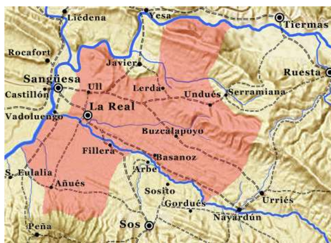
Término La Real

Pedro IV dispuso se cerrase la villa de La Real con murallas en 1357, para lo que destinó las primicias de varios lugares de la zona obligando a los hombres de esos lugares a defenderla en tiempo de guerra 23 . El rey aragonés con motivo de la guerra con Castilla mandó que se aceleraran estas obras y en 1360, eximió a los vecinos de la villa de ir a la guerra para que terminaran de construir sus murallas 24 .