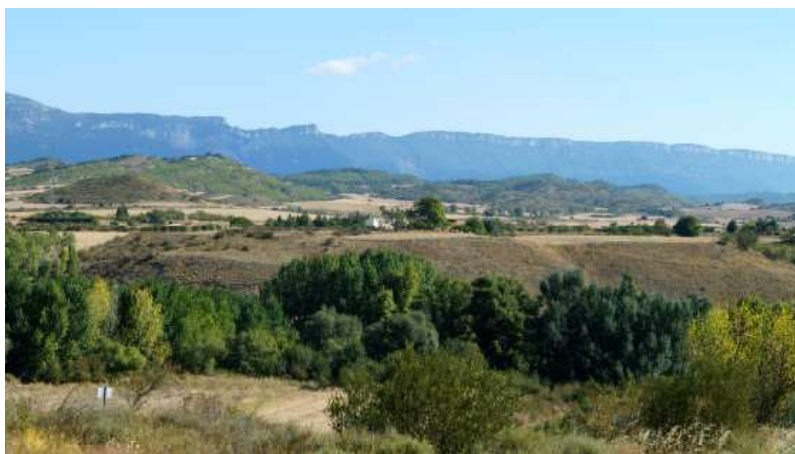
Lugar donde se asentó la nueva villa de La Real

veinte caíces de trigo y de la obligación de acudir a la defensa de La Real en tiempos de guerra, aun abandonando sus bienes en Undués, podían seguir residiendo en el lugar 10 . Lo mismo hicieron otros infanzones que también fueron autorizados a quedarse en sus casales, por lo que no desaparecieron del todo aquellas antiguas localidades donde también permanecían en pie sus iglesias, San Pedro en Añués, San Martín en Undués, Santa María en Lerda, San Bartolomé en Ull y San Pedro en Fillera, todas ellas pertenecían a la nueva iglesia de Santa María de La Real 11 .