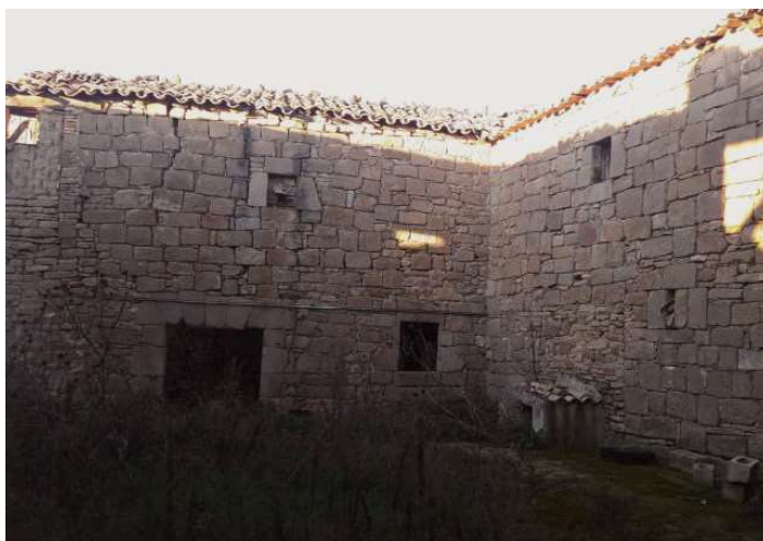
Patio interior Corral del Panchazo.

En la actualidad solo podemos ver como testimonio de la azarosa existencia de esta antigua villa, los corrales del “Panchazo y del “Perdiz”. De su iglesia, más tarde ermita, sabemos que permaneció en pie y con culto hasta bien entrado el siglo XIX.