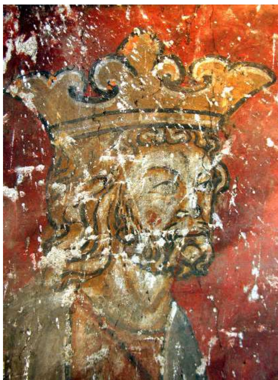
Detalle de Herodes. Pinturas góticas de la Iglesia de San Salvador.