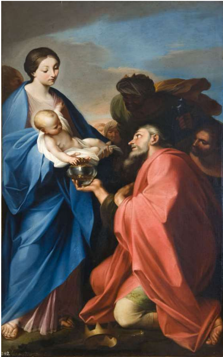
La Adoración de los Reyes.

Destaca en la pintura ese primer plano con el protagonismo de la Virgen, el Niño y uno de los reyes, el que parece de más edad. Estos personajes sobresalen en la escena por su posición y por el énfasis que se hace en la luz y el colorido de estas figuras, creándose de este modo un juego de claroscuros que remarca distintos planos.