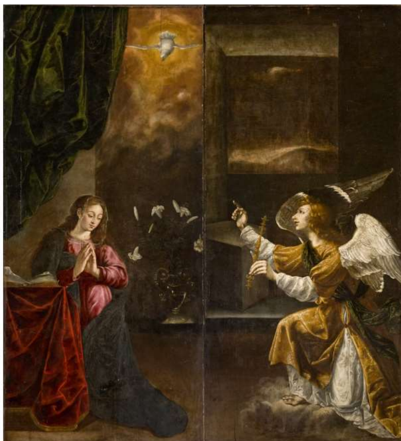
La Anunciación.

La Virgen aparece sentada junto a una mesa, donde se puede apreciar un libro abierto. La mesa se presenta cubierta por un rico tejido de color rojo burdeos, que por la textura bien pudiera ser terciopelo, tratado con gran maestría por el pintor tanto en la textura como en la caída de los plegados.