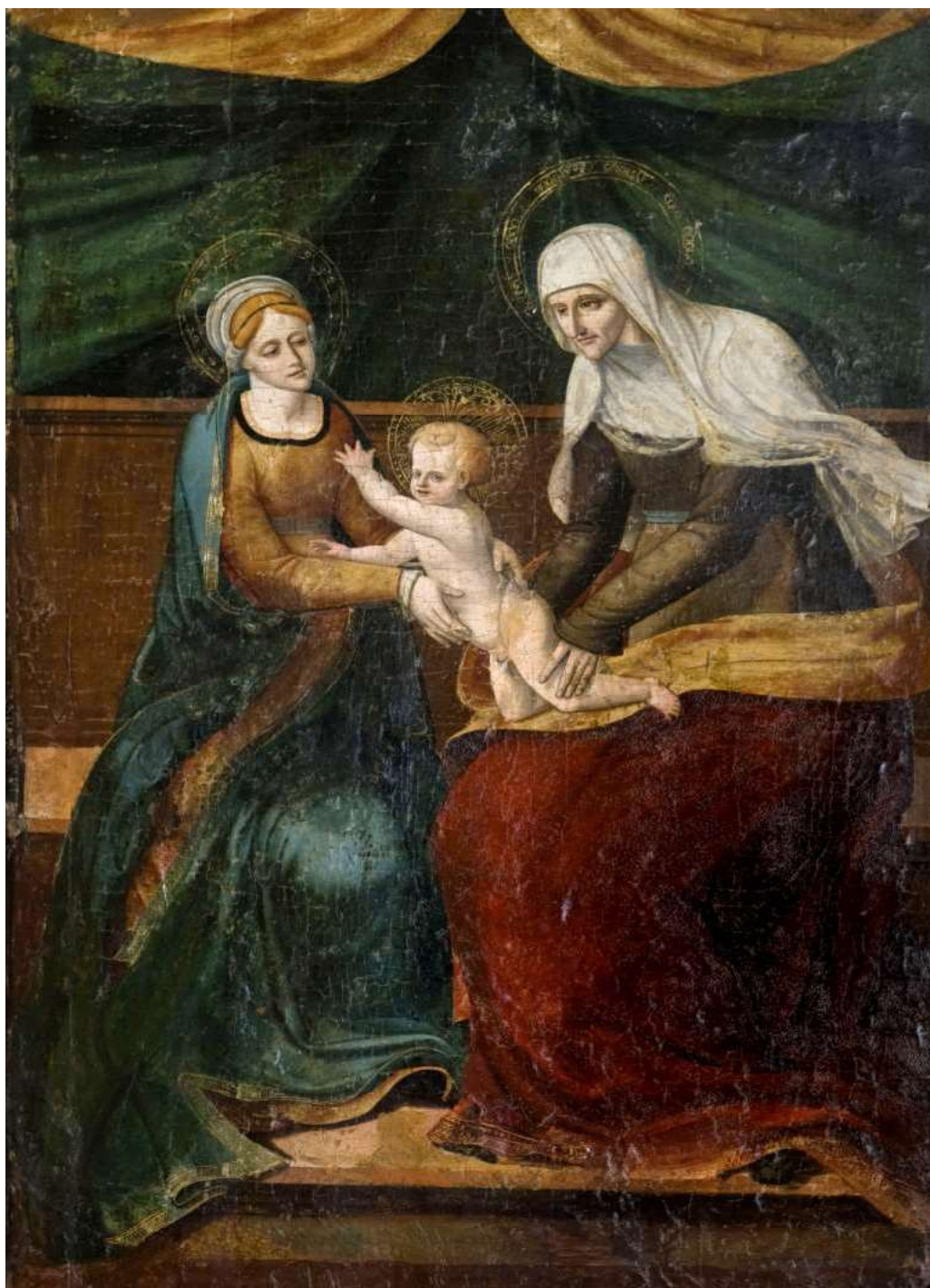
Tabla de Santa Ana, la Virgen y el Niño.

A pesar de que no aparezcan noticias sobre la familia de María en los textos canónicos, la devoción popular mostrará su afán por aclarar el árbol genealógico de Cristo y hará triunfar la historia apócrifa. De este modo, el culto a Santa Ana se introdujo en la Iglesia oriental en el siglo IV y pasó a la occidental en el siglo X , alcanzado su apogeo en la Edad Media.