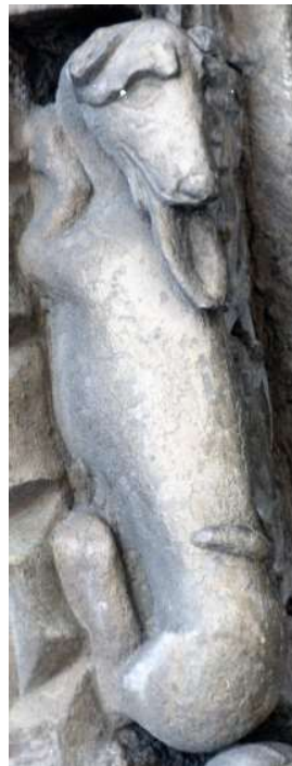
Portada de la iglesia de Santa María la Real de Sangüesa. Detalle.