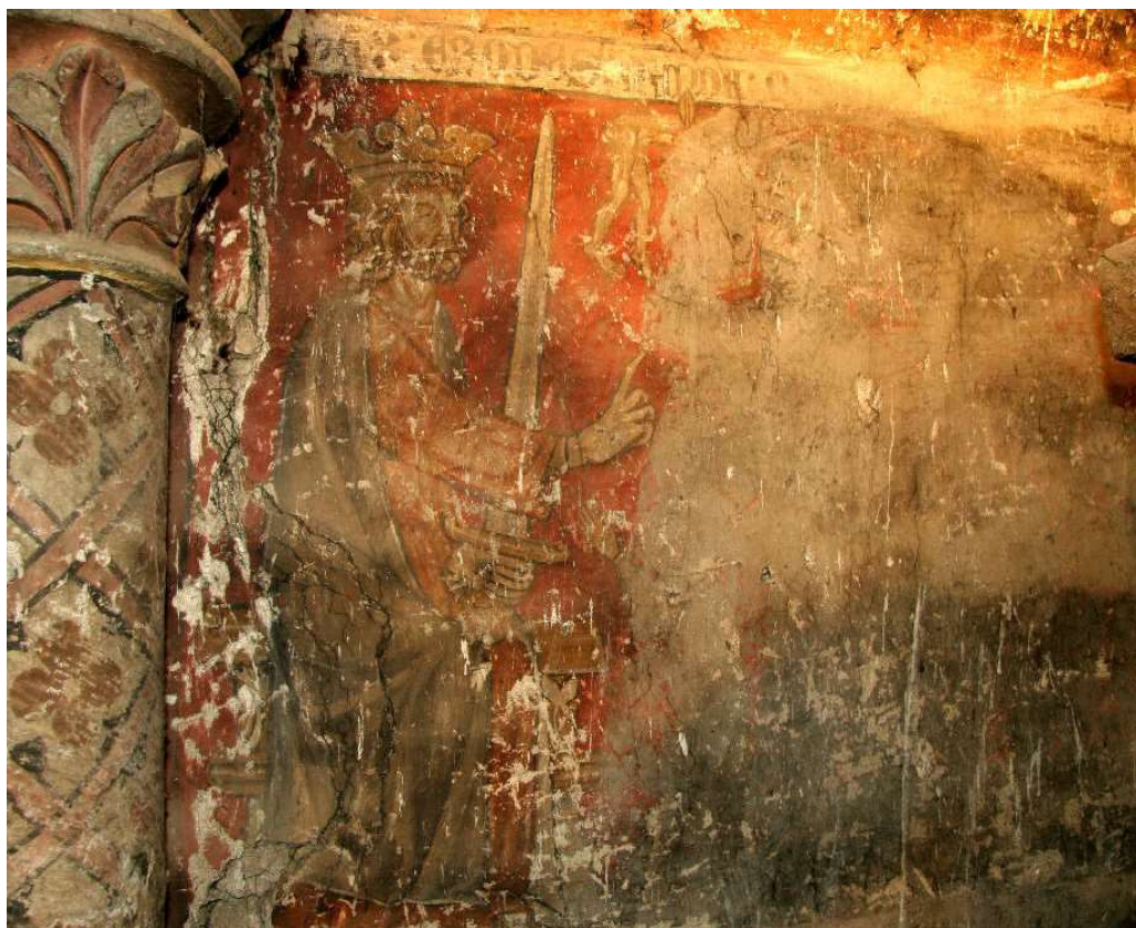
La matanza de los inocentes. Pinturas góticas de la Iglesia de San Salvador.