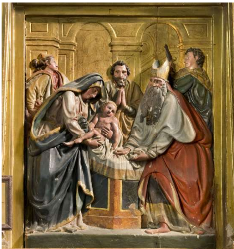
Retablo de San Salvador de Sangüesa. Escena de la Presentación en el Templo.