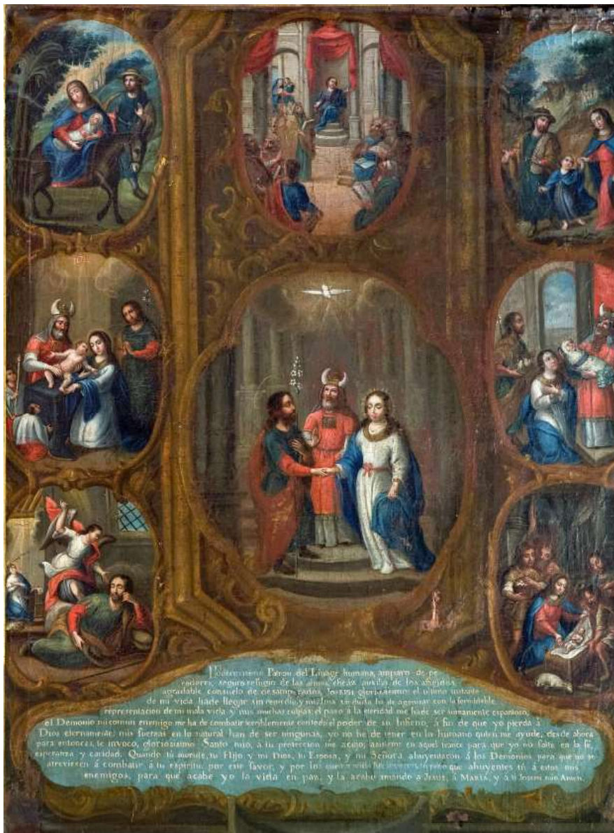
Los desposorios de San José y la Virgen.

La escena central, que a su vez es la de mayor tamaño, ilustra el momento de la boda de San José y la Virgen. Se desarrolla en un fondo de arquitecturas, ya que se ambienta en el templo, y aparecen tres personajes. Oficiando la ceremonia se encuentra el sacerdote judío, que va ataviado con ornamentos cuanto menos curiosos. María aparece representada como una mujer joven - no hay que olvidar que según los textos apócrifos tendría entre 12 y 14 años -, va vestida de blanco con el manto azul, el color de la Virgen. Y por último, el tercer personaje es el esposo, San José.