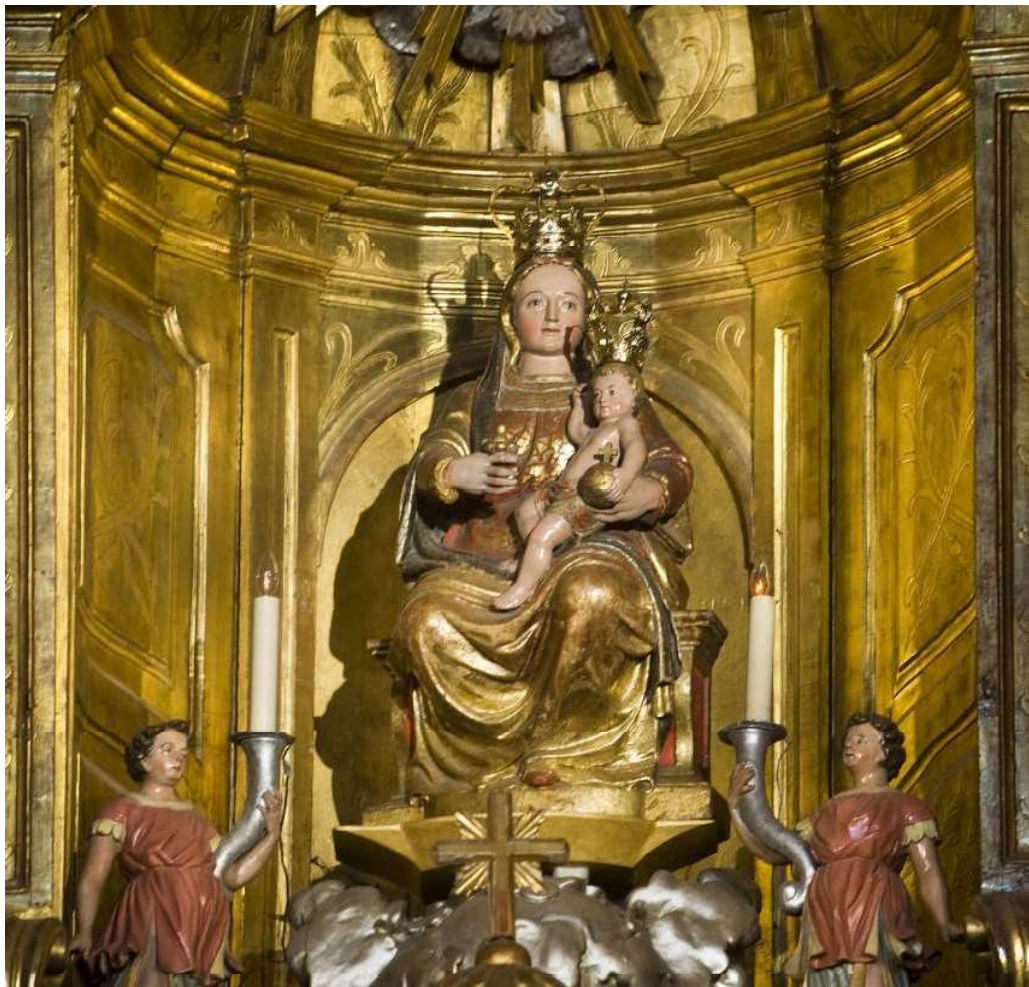
Imagen de Nuestra Señora de Belén, Fotografía de José Luis Larrión.

La imagen de Nuestra Señora de Belén que puede verse en la iglesia de Santiago de Sangüesa, es una hermosa talla renacentista del segundo tercio del siglo XVI. Se trata de una figura sedente sobre trono, realizada en madera policromada, que lleva al niño sobre el brazo izquierdo. El rostro de la Virgen es bello y sereno, como corresponde a una Madonna renacentista, y mira directamente al espectador. En este tipo de representaciones se pone el acento en la humanidad, aflora el sentimiento materno-filial no sólo entre María y Jesús sino entre María y el fiel, que es invitado con la mirada a participar del amor materno que ella transmite. Los pliegues del vestido están bien trabajados, son abundantes y caen de una manera realista. Por su parte el Niño se muestra desnudo, con una postura y anatomía natural, bien conseguida.