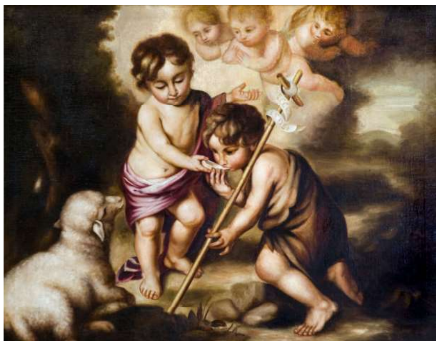
Los niños de la concha. Copia de la obra de Murillo.