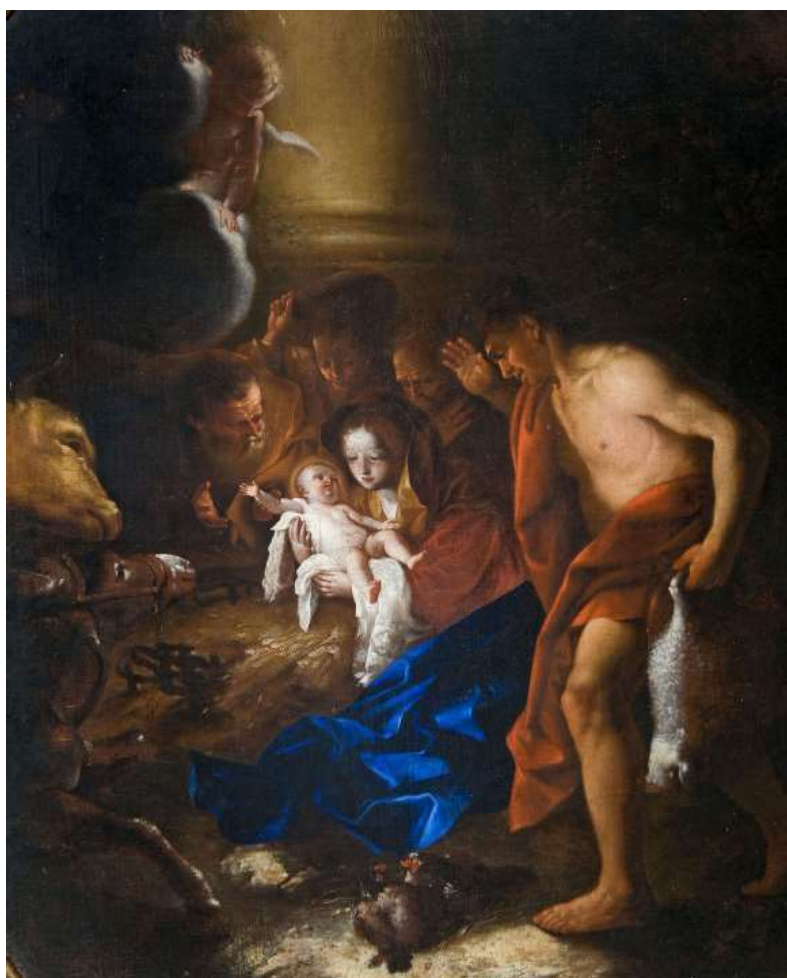
La Adoración de los Pastores.

Esta temática de la Adoración de los Pastores tiene como fuentes el Evangelio de San Lucas (2, 8-21) así como los evangelios apócrifos del Pseudo Mateo (Cap. XIII) y el Evangelio armenio de la Infancia (Cap. IV). De los evangelios canónicos, el de San Lucas es el único que recoge este pasaje del nacimiento de Cristo. El relato bíblico describe cómo un ángel se aparece a los pastores para anunciarles el nacimiento del Niño Dios y dónde pueden encontrarlo.